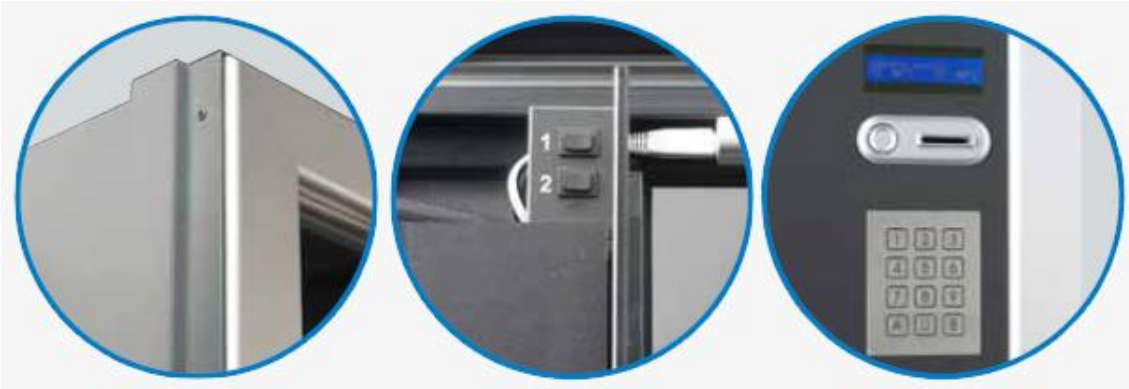
Barras laterais e de topo anti-roubo