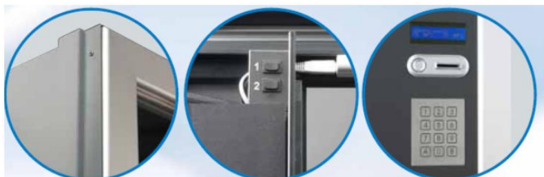
Barras laterais e de topo anti-roubo